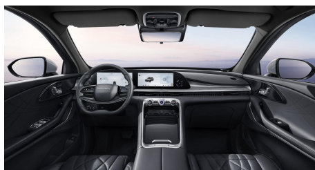
Černý interiér 30 000 Kč