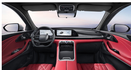
Červený interiér 0 Kč