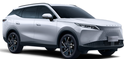
Khaki White 0 Kč