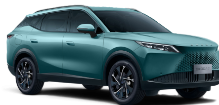
Misty Green 20 000 Kč