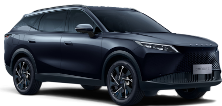
Carbon Black 20 000 Kč