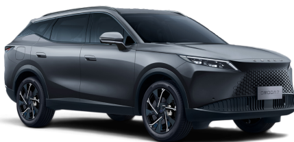
Matte Gray 30 000 Kč