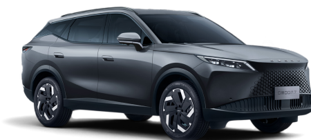
Matte Gray 30 000 Kč