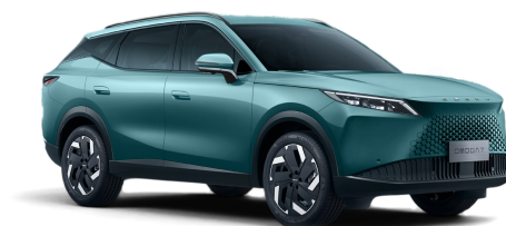
Misty Green 20 000 Kč