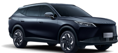
Carbon Black 20 000 Kč