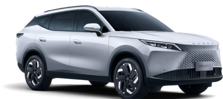
Khaki White 0 Kč