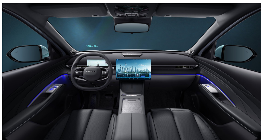
Černý interiér 0 Kč