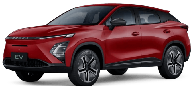
Krvavě červená 0 Kč