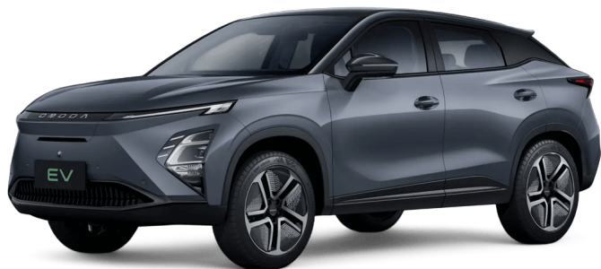
Fantomově šedá 13 000 Kč