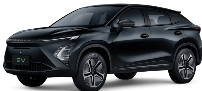
Uhlíkově krystalická černá 13 000 Kč