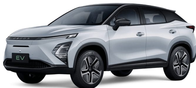
Uhlíkově krystalická černá a khaki bílá 18 000 Kč