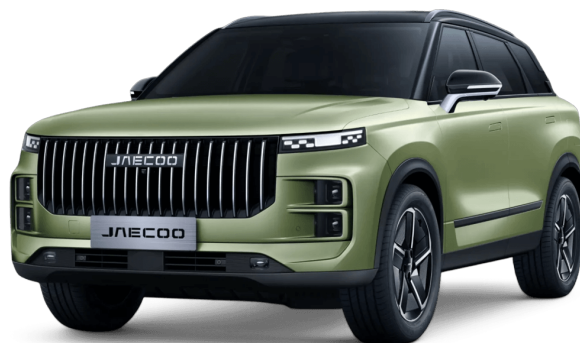
Uhlíkově krystalická černá a Modelová zelená 20 000 Kč