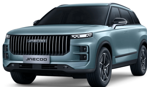
Olivově šedá 15 000 Kč