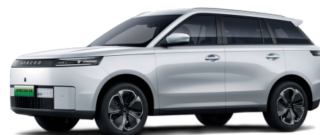
Snowy White 14 000 Kč