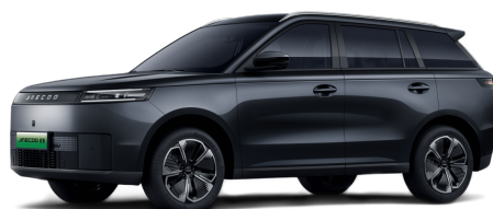
Canyon Black 14 000 Kč