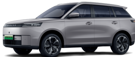
Fjord Gray 14 000 Kč