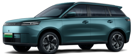
Alpine Green 14 000 Kč