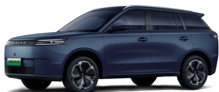
Glacier Blue 0 Kč