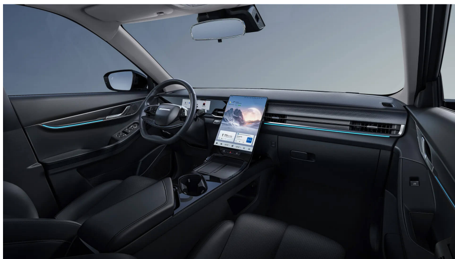
Černý interiér 0 Kč