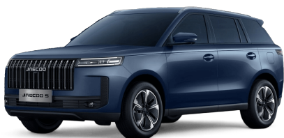
Glacier Blue 0 Kč