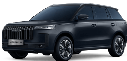
Canyon Black 14 000 Kč