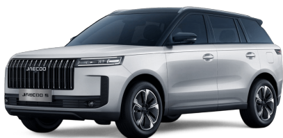
Snowy White / černá střecha 19 000 Kč