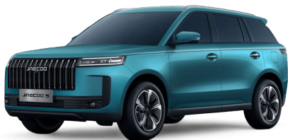
Alpine Green 14 000 Kč