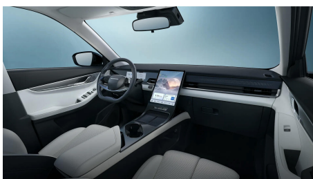
Světle šedý interiér 10 000 Kč