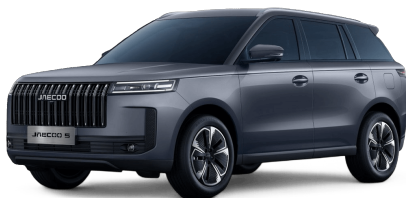
Zircon Gray 14 000 Kč