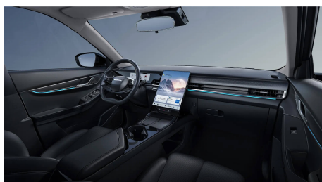
Černý interiér 0 Kč